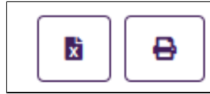
Botões respectivos de download (XLS/Excel) e impressão

Também há a funcionalidade de impressão do relatório e também a possibilidade de fazer o download do relatório em formato XLS (Excel). Dentro do relatório, após o usuário apertar o botão de impressão ou download, o sistema realizará a impressão/download no seguinte formato: Cabeçalho (Nome e filtros do relatório) e Corpo (Colunas e linhas do relatório).